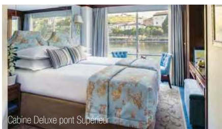
Cabine Deluxe pont Supérieur